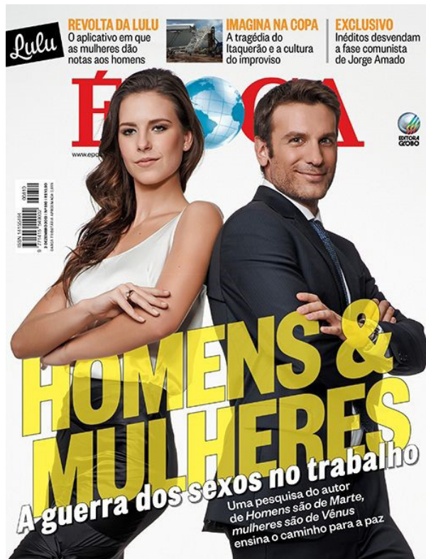
Figura 1. Capa de Época , ed. 810, 02/12/2013.

O gancho para a matéria foi o lançamento de Trabalhando juntos 2 , novo livro de John Gray, autor do grande sucesso de autoajuda Homens são de Marte, mulheres são de Vênus . O best-seller publicado em 1992