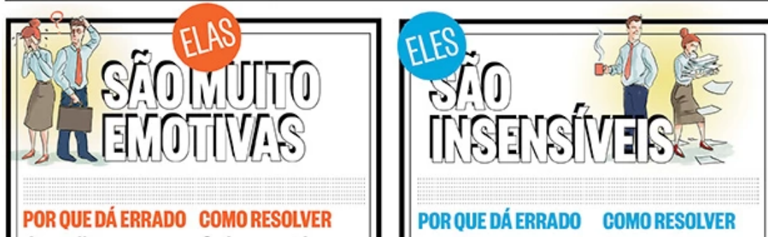
Figura 2. Dois dos boxes da matéria “Como fazer a trégua dos sexos”, da revista Época (2013).