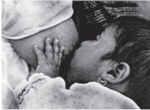
Figura 5. Tina Modotti. Niña amamentándose [Bebê se amamentando], México, c. 1926-1927.