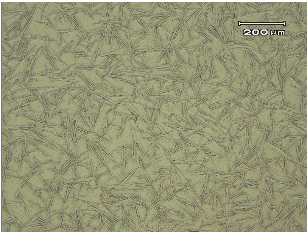
Figura 2: Metalografia da chapa de NiTi . Ataque: 30 ml de ácido acético glacial, 5ml de ácido nítrico e 2 ml de ácido fluorídrico (100 X ).

As fotografias nas Figuras 2 e 3 foram obtidas por meio da microscopia óptica onde se obtém resolução de 0,2 \mu\text{m} , sinal de luz refletida e boas imagens. Estas fotografias correspondem a amostras preparadas em seu estado de recebimento do fabricante.