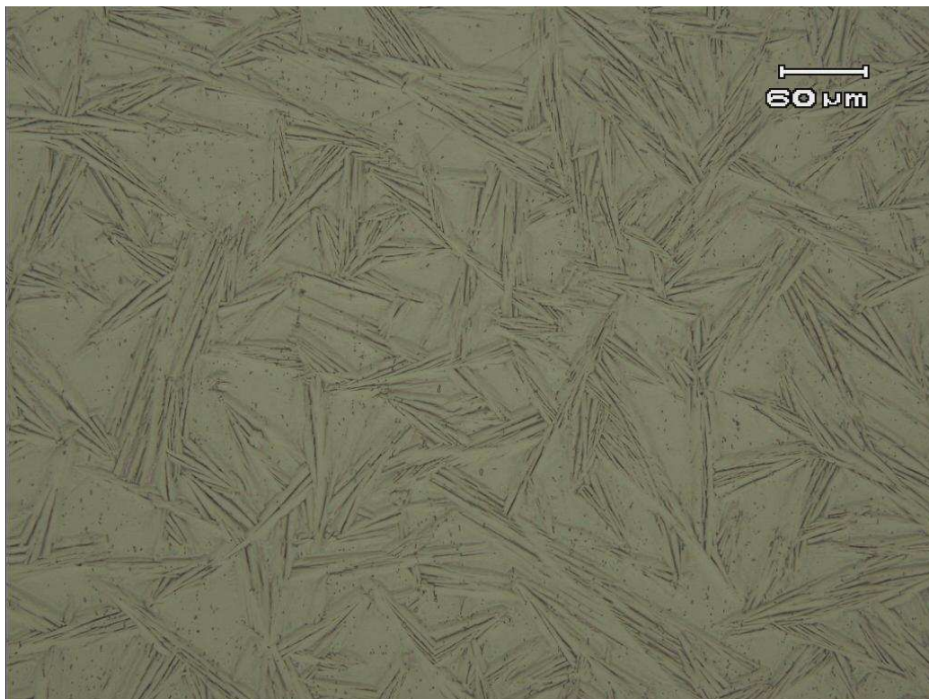
Figura 3: Metalografia da chapa de NiTi . Ataque: 30 ml de ácido acético glacial, 5ml de ácido nítrico e 2 ml de ácido fluorídrico (200 X ).

Na temperatura de análise de 22°C o ensaio DSC permitiu visualizar martensita e austenita em quantidades semelhantes devido às amplitudes térmicas de resfriamento ( ec ) e de aquecimento ( eh ) serem semelhantes. As amplitudes térmicas são dadas pelas fórmulas: aquecimento ( eh = M_f - M_s ) e resfriamento ( ec = A_f - A_s ). Interessante relatar que as metalografias do NiTi diferem bastante com o tempo de ataque dos reagentes químicos mas em todos os ensaios a microscopia óptica evidenciou mais a estrutura martensítica típica em formato de lâminas do que austenita o que pode ser atribuído ao preparo da amostra.