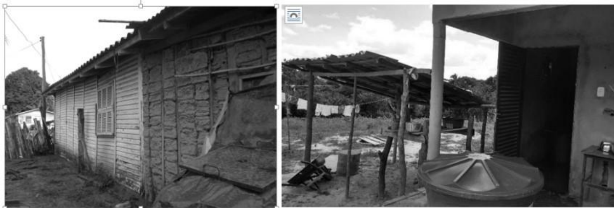
Figuras 6 e 7: Moradia pré-fabricada em madeira dos anos 1980, em Buriticupu, e jirau em madeira nas casas recém-ocupadas do PMCMM em Belágua, Maranhão.

Assim, reproduzindo mecanicamente soluções pensadas para famílias de pequenos agricultores inseridos no mercado de produção e consumo, a proposta de oferecer “moradia digna” aos camponeses maranhenses demonstra suas limitações, pois são as condições de vida que determinam os modos de morar, obrigatoriamente compatíveis com a capacidade de sobrevivência do grupo social. Uma situação análoga àquela analisada por Hassan Fathy para os camponeses pobres do Egito e ainda que não tratemos aqui de casas pré-fabricadas no sentido literal, a questão é a mesma, pois, em ambos os casos, se trata de “casas pré-concebidas”.