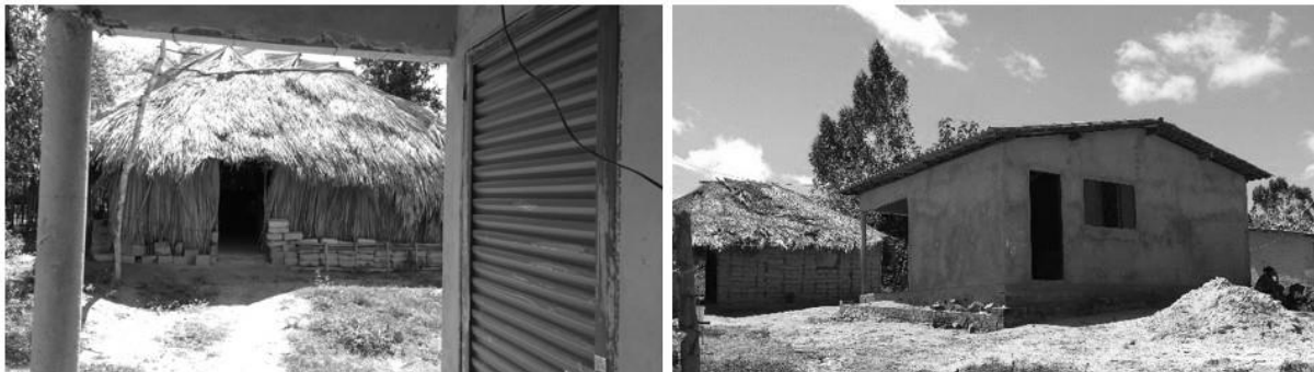
Figura 2 e 3: A permanência da moradia de palha e taipa de mão sem revestimento no Povoado Pequizeiro, Município de Belágua, Maranhão.

Comparadas com as autoconstruções rurais que vieram substituir, o desempenho térmico, acústico e lumínico das unidades habitacionais é inferior aos da taipa de mão e do adobe, provocando diferentes reações, desde aquelas famílias que protelaram a saída da casa de adobe, maior e mais confortável, aos idosos que se negaram a mudar e continuaram a morar na precária, mas fresca, moradia de terra e palha (Figuras 2 e 3).