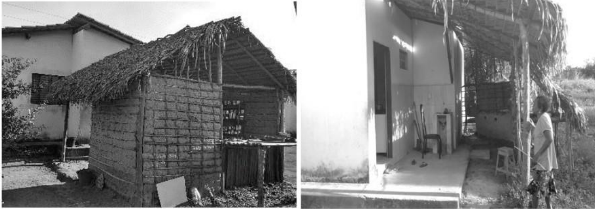
Figuras 4 e 5: Cozinha e jirau de taipa de mão com cobertura de palha em moradias do PNHR no Povoado Puçõ, Município de Presidente Vargas, Maranhão.

E esse é um fato relevante, pois como as estatísticas sociais indicam o agravamento das condições de privação dos camponeses, a tendência em retornar aos materiais extraídos diretamente da natureza se impõe, resultando na adoção de tecnologias acessíveis, isto é, a autoconstrução com terra, palha e madeira.